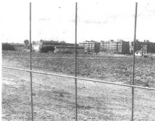
La zona del parque se ha vallado para acometer los trabajos. ■ e. v.

La segunda característica especial de este parque es que estará telecontrolado. El proyecto Life contempla la utilización de sensores para vigilar el desarrollo de estos suelos y recopilar información, que será enviada a una base de datos para planificar las estrategias de crecimiento de esta zona verde. Así, se podrá saber cantidades de agua en el subsuelo, calcular los crecimientos de los ejemplares mediante la medición de su diámetro y altura, etc... Este ensayo, en el que parti-