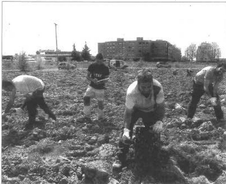
Trabajos de plantación en el Soto de la Medinilla.

Está previsto que tales actuaciones se lleven a cabo con voluntarios de empresas y colectivos que deseen participar en este proyecto medioambiental.