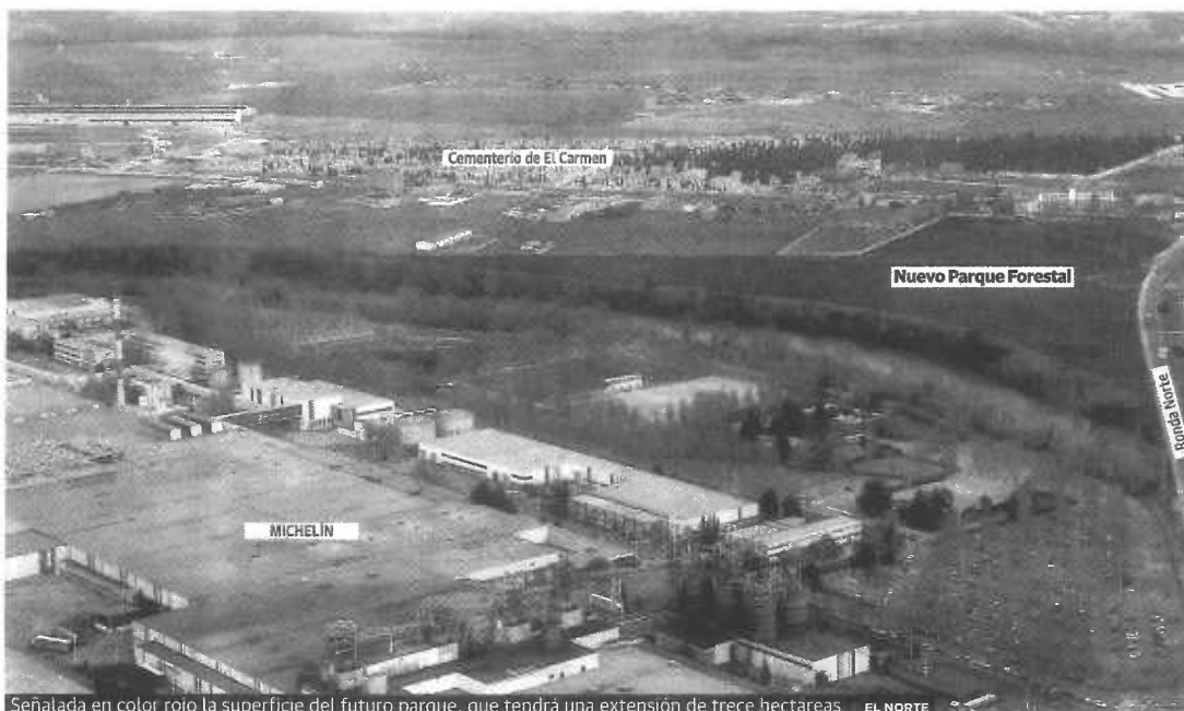
Señalada en color rojo la superficie del futuro parque, que tendrá una extensión de trece hectáreas