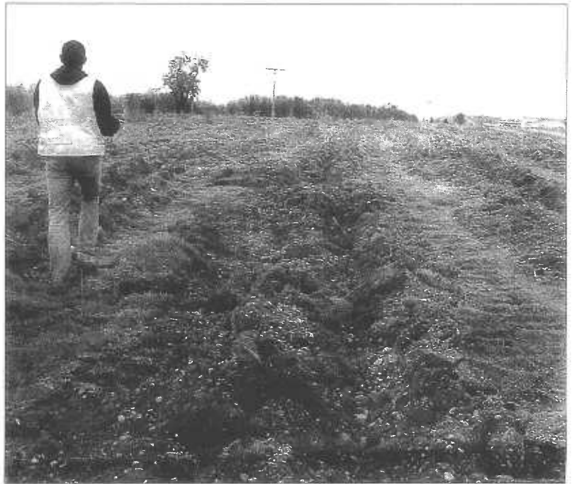
La plantación de los árboles se realizará en una superficie de 13,1 hectáreas en Soto de Medinilla.

Por ello, el tiempo necesario para que la parcela pueda verse como un espacio con «importante» masa arbolada puede dilatarse hasta los 20 años. Este futuro parque forestal se ubica en una parcela de 13,1 hectáreas y orografía plana, delimitada por el río Pisuerga, la Ronda Norte, la ave-